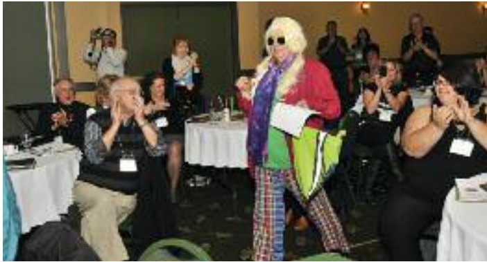
Attendue de tous, la légendaire Vanna Barbara a fait une entrée remarquée à l'émission « Macrac TV »