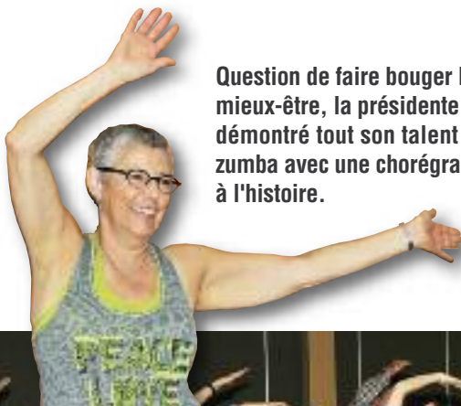
Question de faire bouger les gens vers leur mieux-être, la présidente du MACS-NB a démontré tout son talent de danseuse de zumba avec une chorégraphie qui passera à l'histoire.